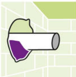
Voor het vullen van leidingdoorvoeren.