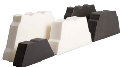
In verschillende vormen en kleuren