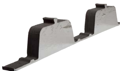
Leverbaar met aluminium coating